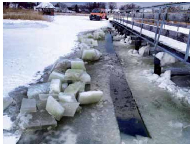
die vielfältigen Tätigkeiten des Borner Bauhofs 2015: Baumschnitt, Instandsetzung Postweg, Sicherung Badesteg ...

Auch wenn die Saisonauswertung der Kurverwaltung im März im Borner Hof stattfinden wird, sollen an dieser Stelle bereits einige Zahlen veröffentlicht werden, die den momentanen Stand darlegen.