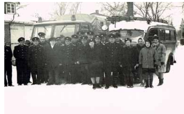
Februar 1969: Übergabe des Robur LO 1800

Dieses Fahrzeug „verschwand“ dann zum Kriegsende 1945 und die Handdruckspritze musste wieder in Dienst genommen werden. Im Jahre 1954/55 bauten die Kameraden dann einen Bus Garant zum Löschfahrzeug um, welcher bis 1969 im Einsatz war. Ein fabrikneuer Robur LO 1800 wurde im Jahre 1969 durch die Kameraden übernommen. Dieser war bis 1993 im Einsatz und wurde durch zwei gebrauchte Fahrzeuge aus den alten Bundesländern ersetzt. Zum einen war dies ein Mercedes-Benz 408 LF8 mit Metz-Aufbau, zum anderen ein Magirus-Deutz TLF 16. Dieses Tanklöschfahrzeug wurde dann im Jahre 2006 durch ein gebrauchtes Hilfeleistungslöschfahrzeug vom Typ MAN LF 16/12 Bj. 2003 mit Lentner Aufbau ersetzt. Beide Fahrzeuge sind auch heute noch im Bestand. Da das LF8 Bj. 1972 inzwischen 45 Jahre alt ist, muss hier dringend über eine Neuanschaffung nachgedacht werden.