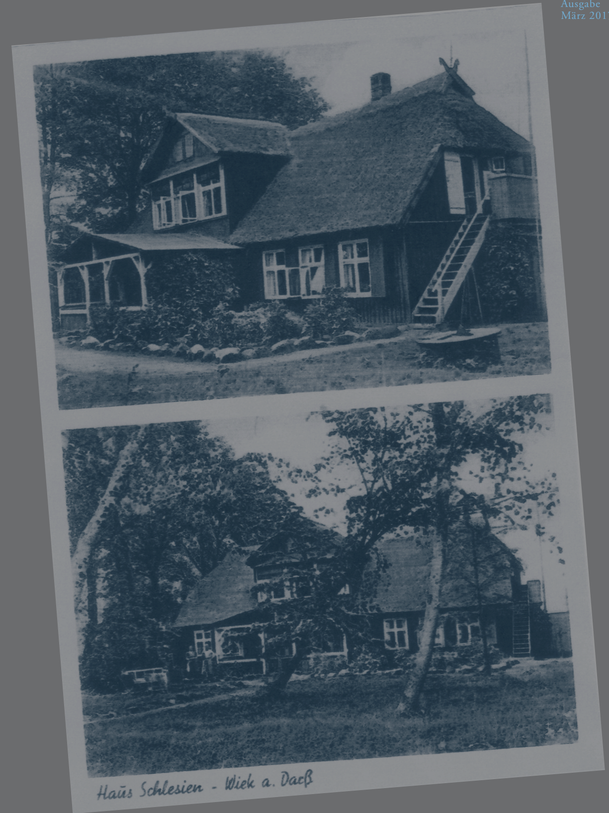
1924 Südansicht des Hauses

Letztendlich wurde der Angeklagte Erdbecher freigesprochen. Beide Schwestern aber für die Tat zum Tode verurteilt. Gertrud ist wohl während der Haftzeit verstorben. Lisbeth soll durch eine Amnestie 1945 aus der Haft entlassen worden sein.