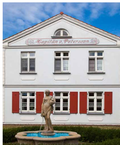
Peterssons Hof in Born

Und glücklich wäre ich, wenn in der jetzigen Amtszeit auch die Entwicklung des Grundstückes neben dem Amt und damit die Sanierung des BMK auf den Weg gebracht werden würde. Im vorliegenden Entwurf sind 15 Wohnungen geplant, davon sieben barrierefrei im Erdgeschoss und acht Wohnungen im Obergeschoss sehen jeweils ein Kinderzimmer vor.