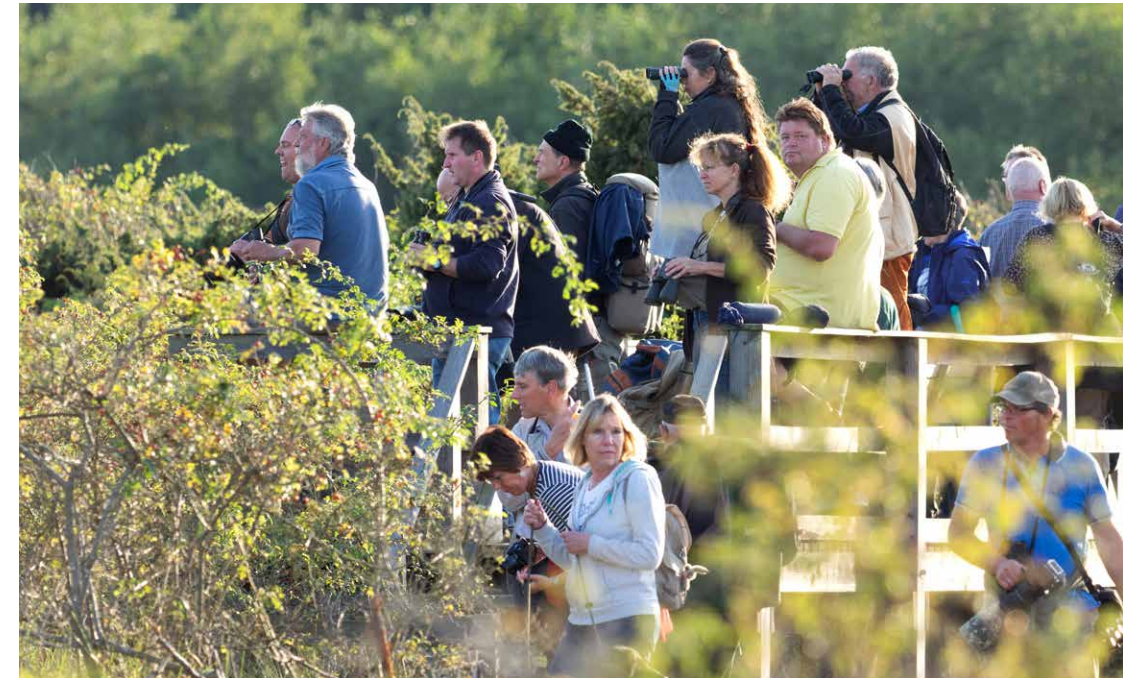
Andrang auf der Fotoplattform am Darßer Ort während der Hirschbrunft

Die heutige Mobilität, das Bedürfnis, innerhalb von Stunden dem Kunden alles Neue anzubieten, haben