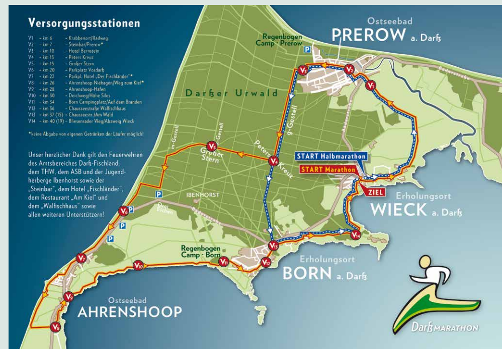
Grafik ©MauGrafik, Born